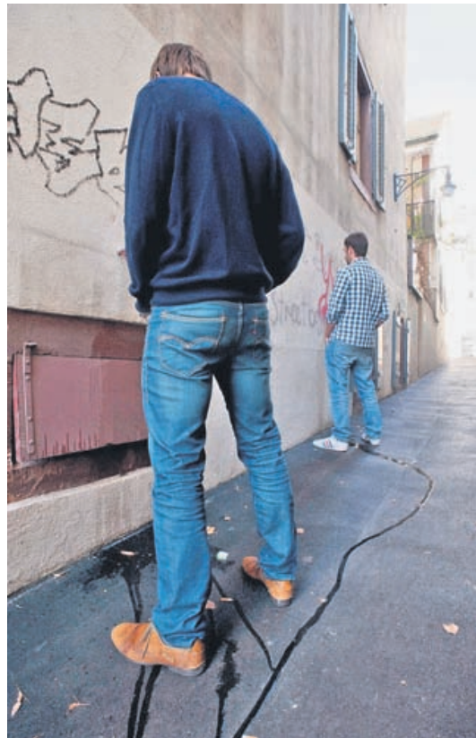
Guerrilla-Pinkeln. Wenn die Wand näher ist als die WC-Anlage.

Kurz nachdem die Reichen ins Gellert abgezogen waren, öffnete in Basel das erste Pissoir 1889 auf dem Schlüsselberg, es ist ein Relikt längst vergangener Toilettenkultur. Mittlerweile gibt es eine ganz neue Generation von Pissoirs, die sich vor allem in Amsterdam grosser Beliebtheit erfreuen: versenkbare. Sie sehen ein bisschen aus wie in der Mitte durchtrennte Litfassäulen. Die Woche über ruhen sie unter der Erde, am Wochenende werden sie hochgefahren. Vischer hat sie gesehen und ist ganz begeistert. Frauchiger im Grunde auch. «Nur ist das Problem bei den versenkbaren Pissoirs, dass man den pinkelnden Mann von drei Seiten her sieht; von hinten von vorne und von der Seite. Das wird in Basel nicht funktionieren.» Und zwar, weil beim Basler Mann, so Frauchiger, die Akzeptanz dazu fehle. Will heissen, der Basler Mann mag es nicht, wenn er beim Pinkeln beobachtet werden kann. Aber andererseits: Wer wild